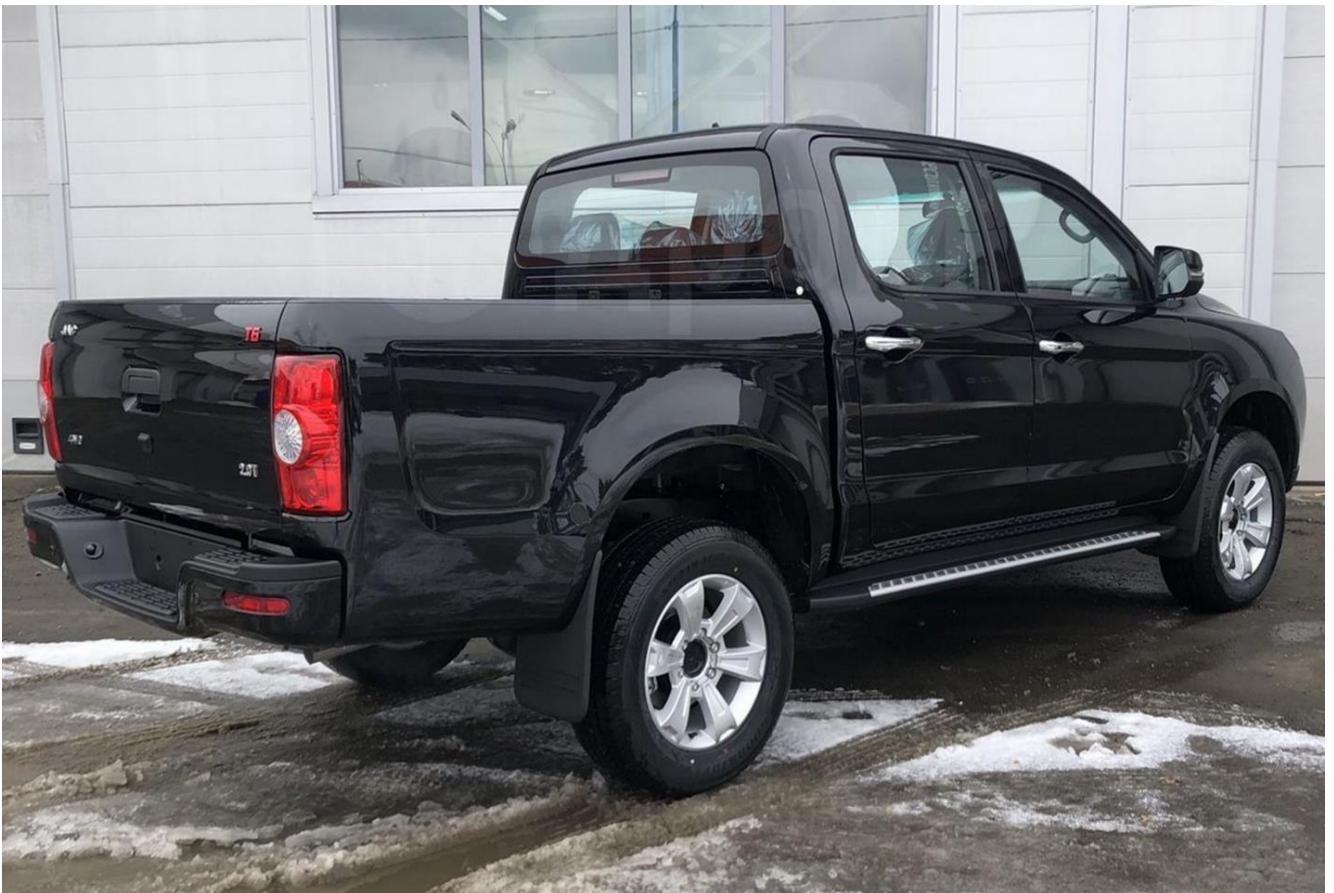
Примерны вид и габариты JAC T6