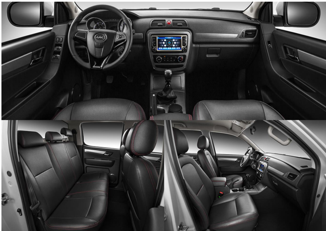
Примерный интерьер JAC T6